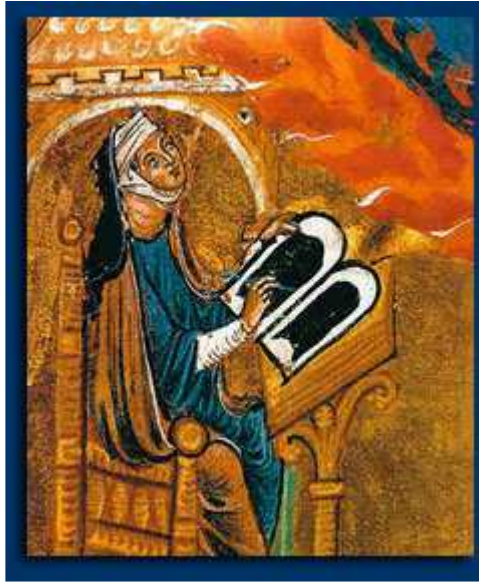
Hildegard von Bingen

groeide en voortkwam uit “een bepaalde soort” zwart water.