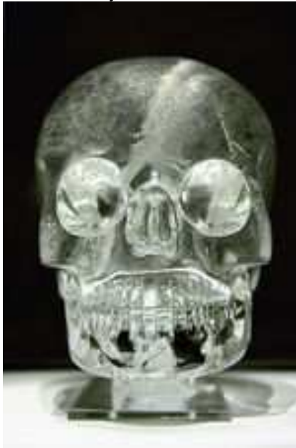
Een schedel uit de collectie van het British Museum in Londen.

Geologische dateringen hebben aangetoond dat deze schedels in ieder geval voor 1.600 jaar voor het begin van onze jaartelling vervaardigd zijn, aldus minstens 3.600 jaar oud.