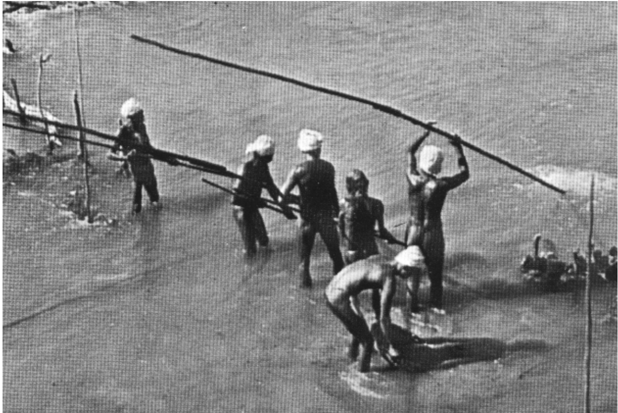
De winning van saffier in een rivier grind bed.